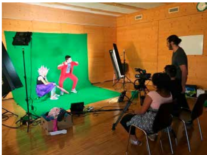
Hypolite, l'homme sans tête en plein tournage

Cette semaine a été très appréciée et a permis aux enfants du quartier de vivre une expérience inédite. Un grand merci au Festival de cinéma jeune public d'avoir rendu cela possible !