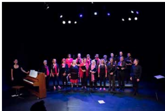
Le chœur des 10 ans de la MQC