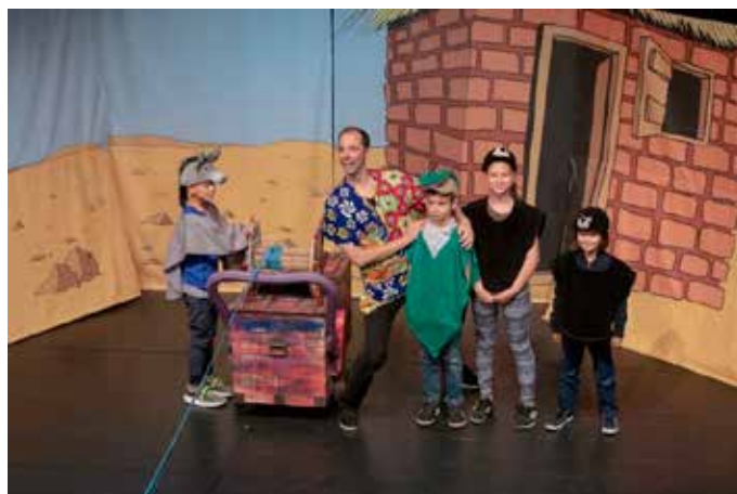
«L'ours blanc et l'or bleu » par la Compagnie Okipik