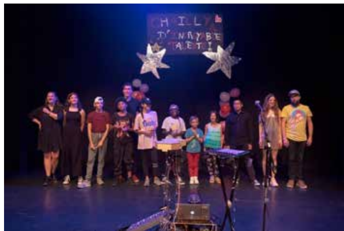
La soirée Chailly à d'incroyables talents

la nuit des Escapades gourmandes. Des projections en boucle étaient également proposées : le film de Bertrand Nobs «Par tous... la maison pour tous» sur la construction de la Maison de Quartier, un film de présentation du Bla-Bla Vote et un film tourné par les Enfants du mercredi. Les ados du quartier ont construit une exposition de photos sur leur vision de la Maison de Quartier. Un projet remarquable d'habitantes du quartier à la main verte et d'Eben-Hézer Lausanne pour la construction en bois a rapproché plus encore la nature de la Maison de Quartier : un tunnel végétal de plusieurs mètres accueillait fièrement les convives. Comment parler des 10 ans sans parler de lanternes ? Des lanternes devant, dedans, dehors, à côté, en-dessus pour illuminer la fête, des étoiles pour les années à venir, pour que le Faire ensemble nous guide pour les décennies à venir. À vous toutes et tous, nous vous adressons nos plus riches et chaleureux remerciements. Un énorme merci à la hauteur de ces moments forts d'échange, de solidarité et de joie partagée !