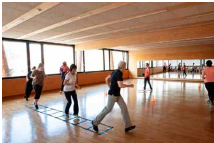
Le cours de remise en forme