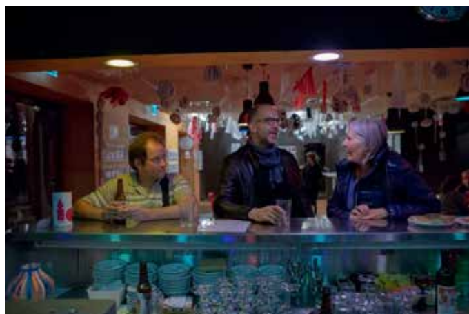
Des membres de l'équipe du CCC en pleine discussion