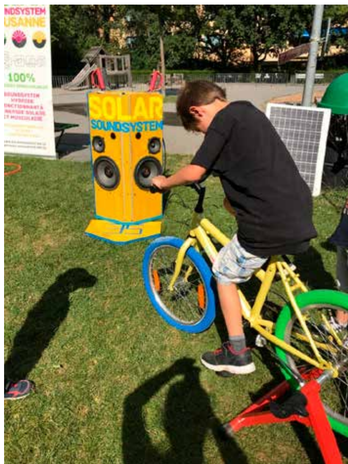
Solar Sound System

Les places au soleil se déroulent sur la place de jeux du Devin, la première et la dernière semaine des vacances d'été. Cette animation permet d'offrir aux familles, qui ne sont pas parties en vacances, un programme d'activités variées. C'est une animation commune de la FASL, c'est-à-dire que sur 9 places de jeux, il y a sur la même période, le même type d'activités, les mêmes ateliers et le même spectacle. En moyenne, une soixantaine de personnes (enfants, adolescents et adultes) était présente chaque jour sur la place, encadrée par une animatrice et 3 moniteurs. Cette année, des activités, des ateliers et un spectacle sur le thème des 4 éléments ont été proposés : fabrication de cerf-volant, création de fusée à eau, spectacle d'acrobatie par la Compagnie Volvio, «Solar Sound Système », Barbapapi et un atelier sérigraphie. Grâce au partenariat avec Table Suisse, un goûter a été offert à toutes et tous chaque jour.