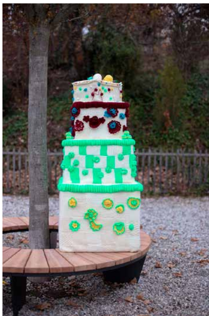
Le magnifique gâteau des 10 ans de la MQC de l'équipe du tricot