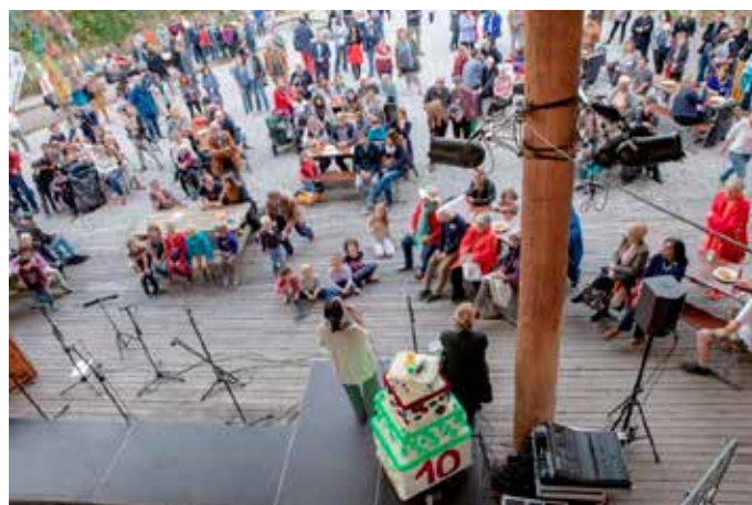
La cérémonie officielle