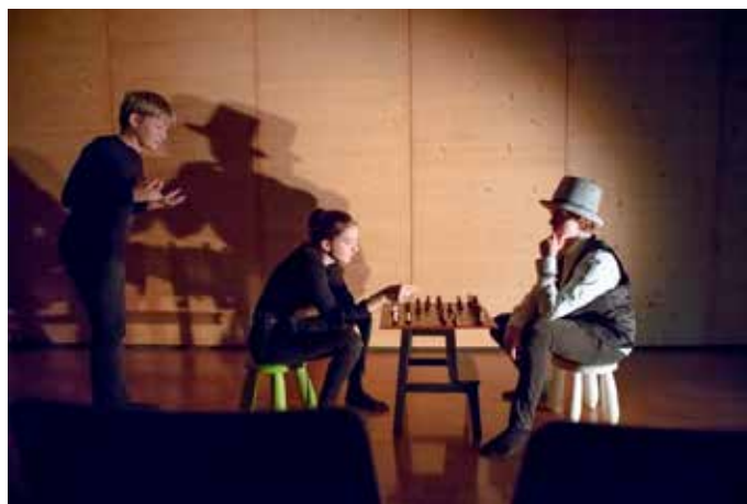
Sanshiro et le Théâtre en Chantier